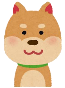
EXビレッジ マスコット犬 レッジ